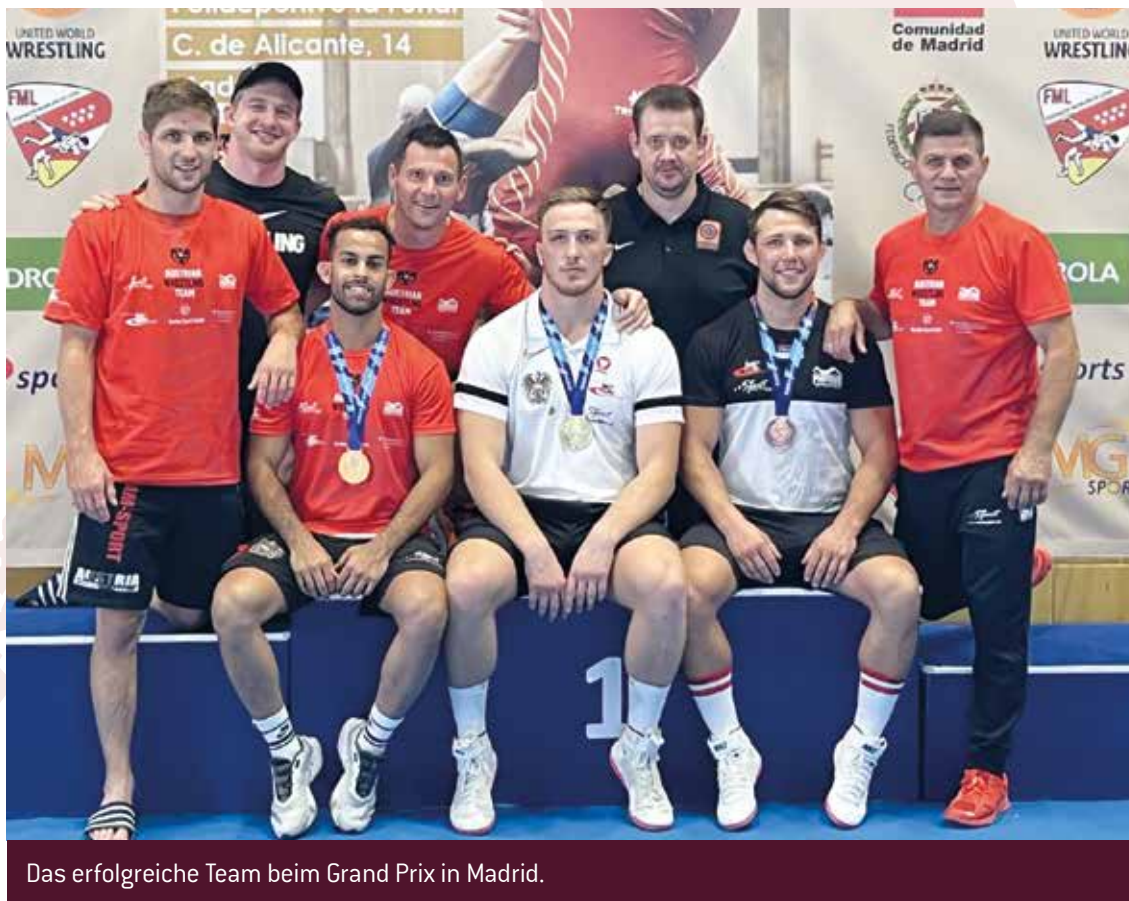
Das erfolgreiche Team beim Grand Prix in Madrid.

Das Gr.-Röm-Nationalteam des Österreichischen Ringsportverbandes konnte beim Weltcupturnier in Madrid 3 Medaillen erringen. Nach einer geschlossenen Teamleistung konnte in der Mannschaftswertung der 4. Platz unter 11 Nationen erreicht werden.