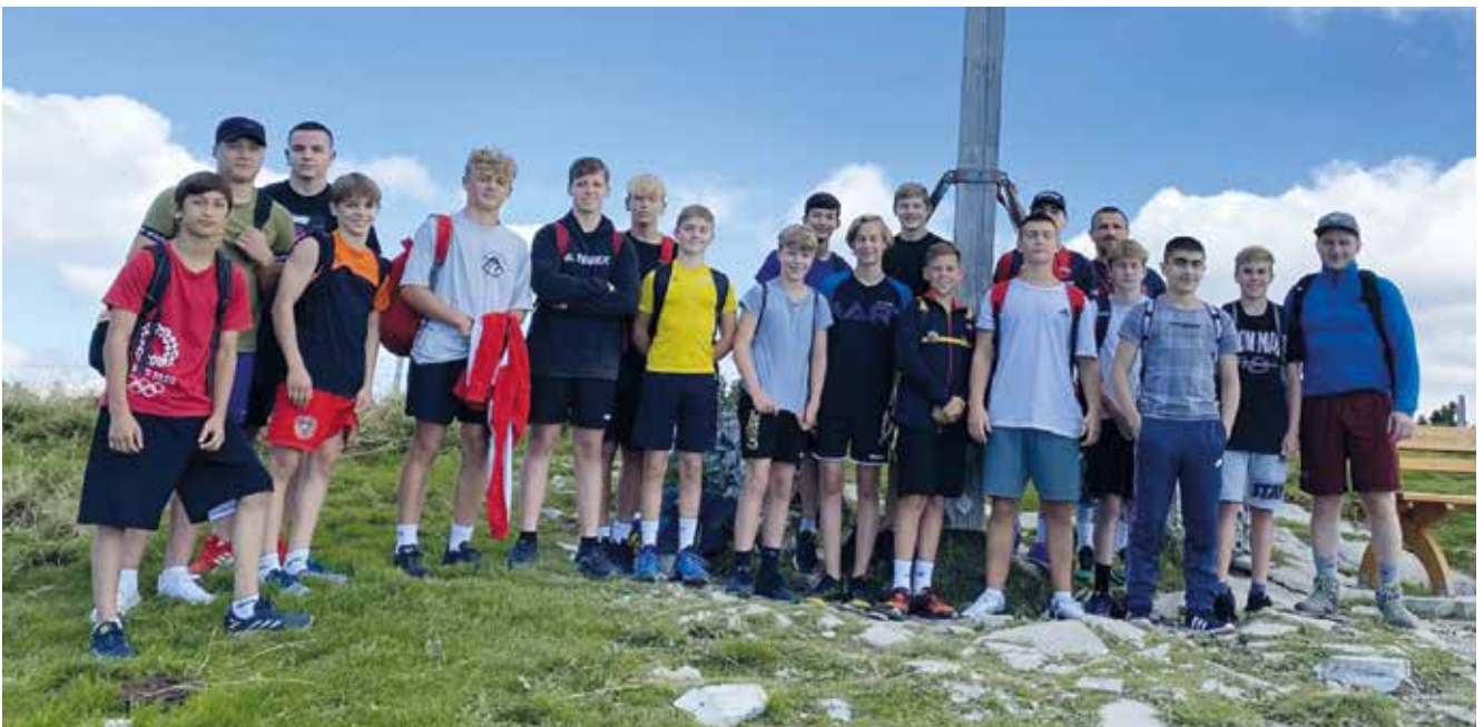
Gruppenfoto nach dem Aufstieg auf den Schlenken in Salzburg.