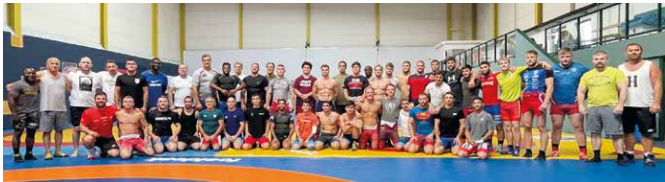
Alle Teilnehmer beim int. Trainingslehrgang in Steinbrunn.

Der Österr. Ringsportverband veranstaltete im Leistungssportzentrum Steinbrunn/Burgenland einen 2-wöchigen Trainingslehrgang an dem mehrere internationale Top-Nationen wie Deutschland, Ungarn, Norwegen, Dänemark, Finnland, USA, Polen, Holland und die Schweiz teilnahmen.