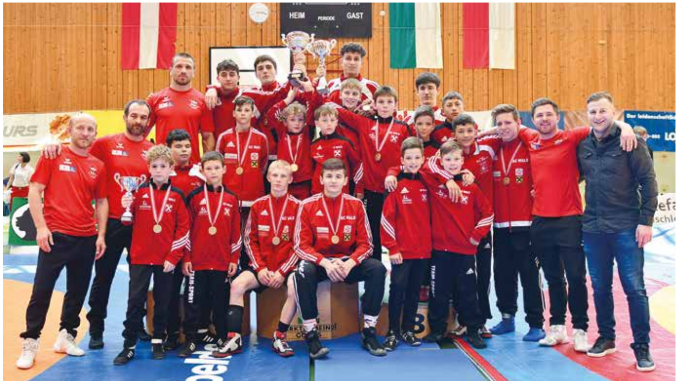
Die Siegermannschaft des A.C. Wals.

Am 21. Mai 2022, fand in der Sporthalle der Mittelschule in Götzis die Österreichische Nachwuchs-Mannschaftsmeisterschaft statt. Die erste Nachwuchsmannschaft des A.C. Wals konnte den Titel des Österr. Nachwuchs-Mannschaftsmeister erringen.