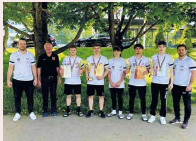
Das erfolgreiche Team beim U20-Grand Prix in Riga.