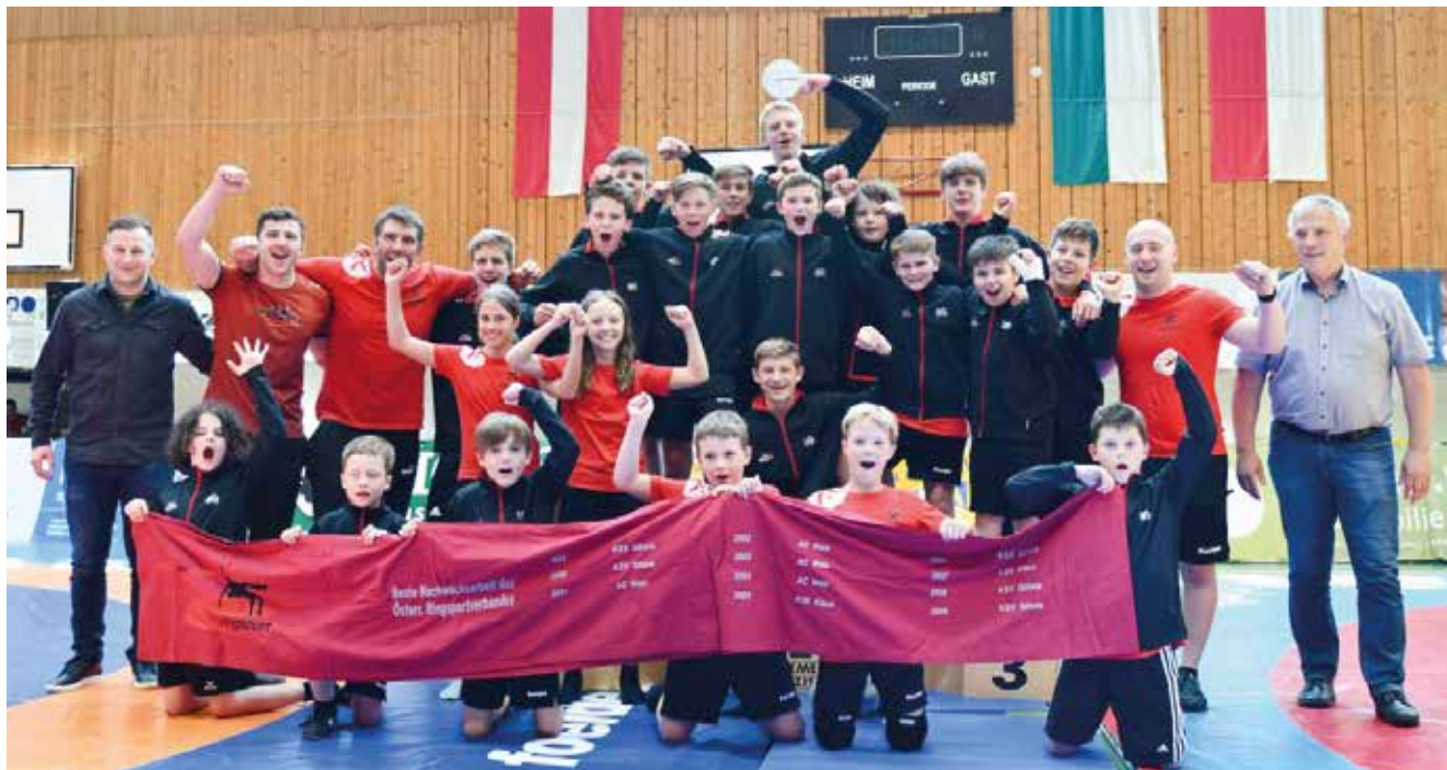
Die Siegermannschaft des RSC Inzing - Gewinner des Roten Bandes.

Der RSC Inzing gewinnt erstmals in seiner Vereinsgeschichte das Rote Band für die beste Nachwuchsarbeit. Auf dem 2. Platz landet der A.C. Wals vor dem KSK Klaus.