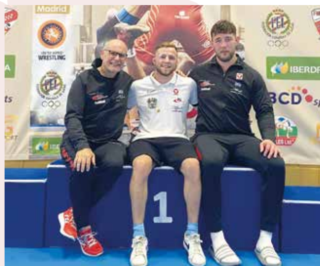
Unser Freistil-Team beim Grand Prix in Madrid.