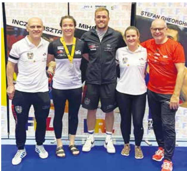
Die Österr. Nationalmannschaft in Bukarest.

"Leonhard hat nach seinem 5. Platz bei der U-17 Europameisterschaft mit dem 7. Platz bei der U-17 Weltmeisterschaft seine Klasse bestätigt. Wenn er sich weiter so gut entwickelt werden wir noch viel Freude mit ihm haben" – Nationaltrainer Amer Hrustanovic.