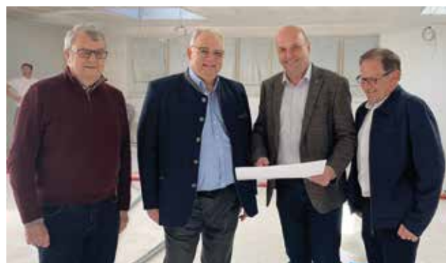
Ringer-Weltverbandspräsident Nenad Lalovic mit den Vereinsverantwortlichen des A.C. Wals.

Der Besuch des Ringer-Weltverbandspräsidenten Nenad Lalovic hat dem Österr. Ringsportverband wieder zahlreiche Möglichkeiten eröffnet. Wir sind guter Dinge auch den Status Ringer-Weltverbandszentrum zu erhalten und uns als 5. Zentrum des Ringer-Weltverbandes dann nennen zu dürfen.