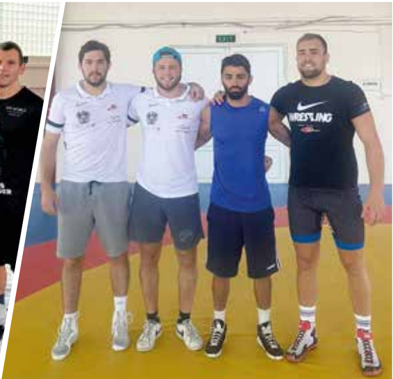
Freistil Nationalmannschaft in Georgien.