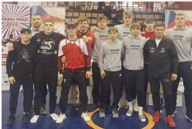
Das ÖRSV-Team beim Grand Prix in Chomutov.

Unsere Gr.-Röm. Nachwuchs-Nationalmannschaft nahm am Grand Prix von Tschechien in Chomutov teil. Dieses Turnier wurde in die Altersklassen U17 und U20 eingeteilt und war mit 300 Startern aus 20 Nationen sehr stark besetzt.