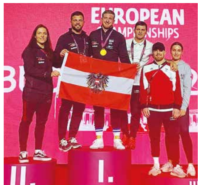
Das Gr.-Röm. Team des ÖRSV.