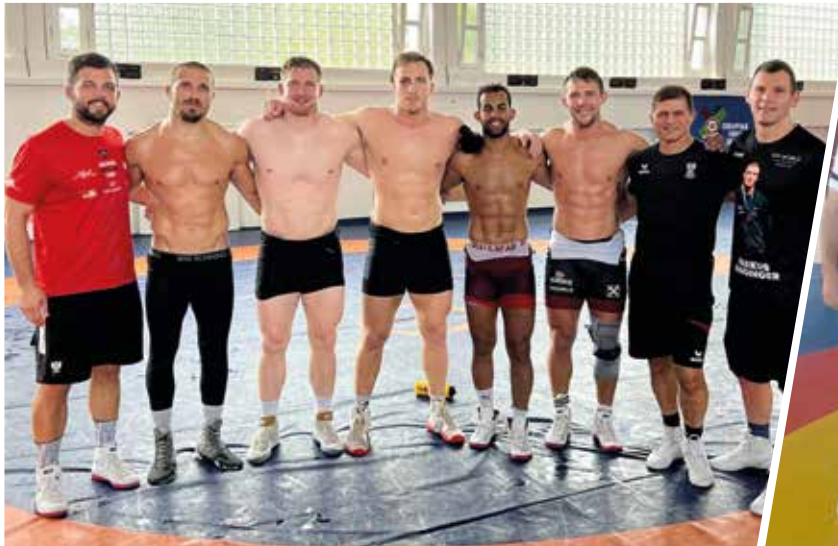
Das Gr.-Röm-Nationalteam der Männer in Tata/Ungarn.

Gute Stimmung herrschte bei den Lehrgängen der Nationalmannschaften in Georgien, Deutschland und Ungarn. Das Trainer Team war vom Einsatz sehr begeistert und die Nationalmannschaften holten sich den letzten Schliff vor den Weltmeisterschaften in Belgrad/Serbien. Das Gr.-Röm-Nationalteam der Männer hielt den Trainingslehrgang in Tata/Ungarn ab, die Nationalmannschaft im Freistil trainierte in Georgien und das Nationalteam der Frauen war in Hennef/Deutschland zu Gast.