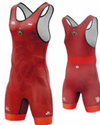
Nationalmannschaft Trikot Rot