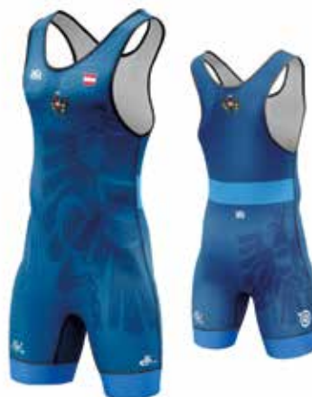
Nationalmannschaft Trikot Blau