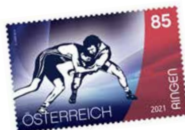
Die erste Ringerbriefmarke in Österreich