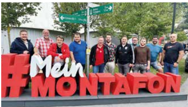
Das Team der ÖRSV-Kampfrichter in Montafon.

Vom 26. – 28. August fand der zweite Kampfrichterlehrgang des Jahres im Montafon/Vorarlberg statt. Der Lehrgang wurde genutzt, um sich für die bevorstehende Bundesligasaison vorzubereiten.