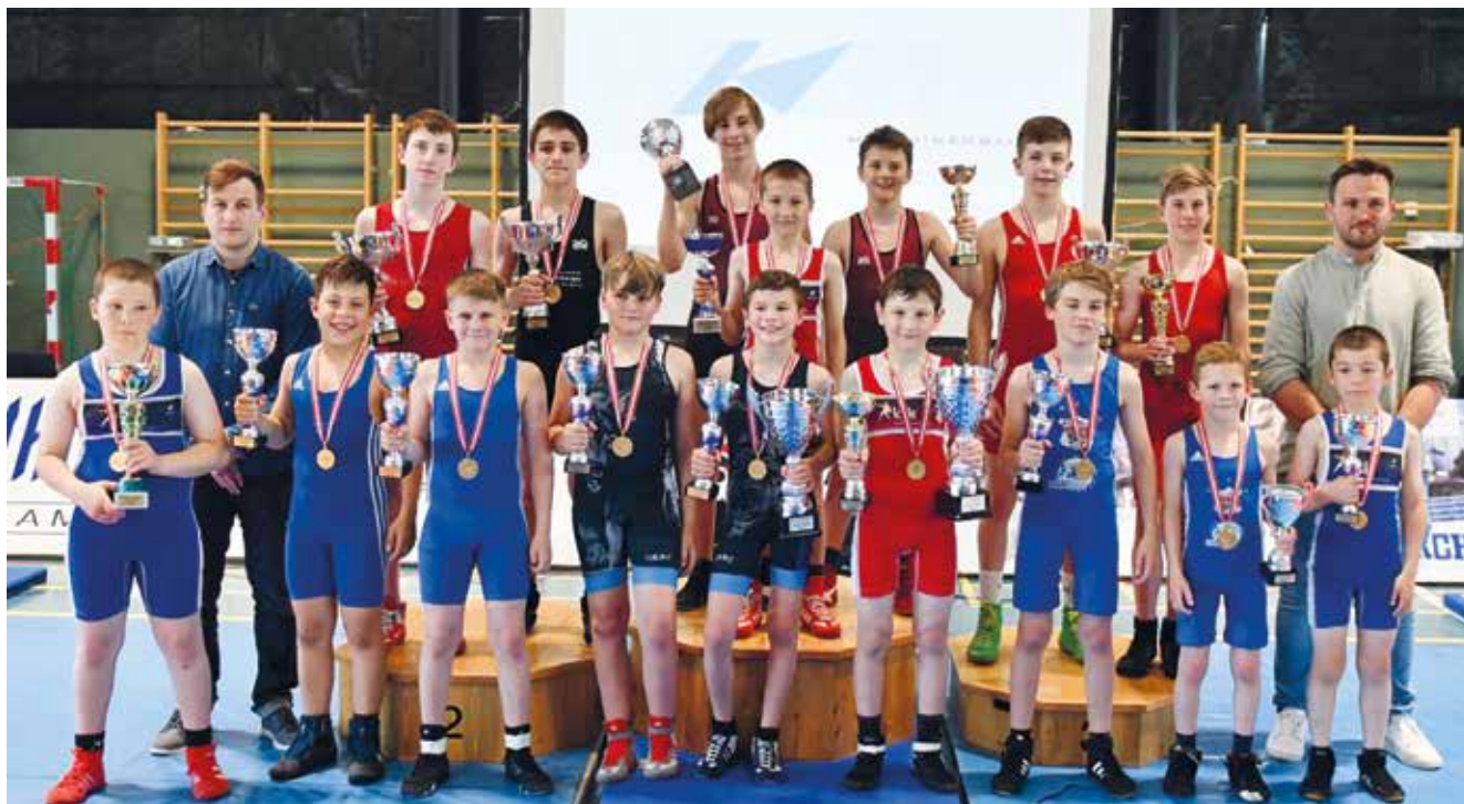
Die Österr. U-14 Meister der offenen Meisterschaft im Freistil.