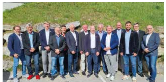
Die Teilnehmer der BLO-Konferenz

Der ÖRSV bedankt sich bei allen Mitgliedern und Gästen für den unvergesslichen Abend und freut sich auf die nächsten hoffentlich so erfolgreichen Jahre!