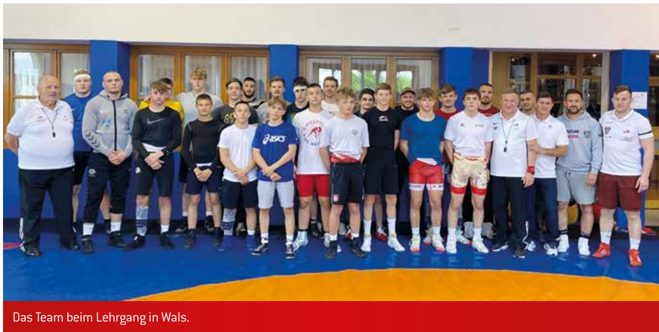
Das Team beim Lehrgang in Wals.

Das gesamte Gr.-Röm. Nachwuchs-Nationalteam hielt einen int. Lehrgang in Wals ab. Der Lehrgang diente für die U17-Athleten als letzte Maßnahme vor der U17-EM Mitte Juni in Bukarest.