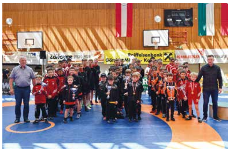
Aufstellung der Mannschaften - Platzierungen 1 bis 6.