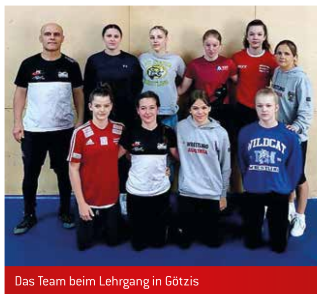
Das Team beim Lehrgang in Götztis