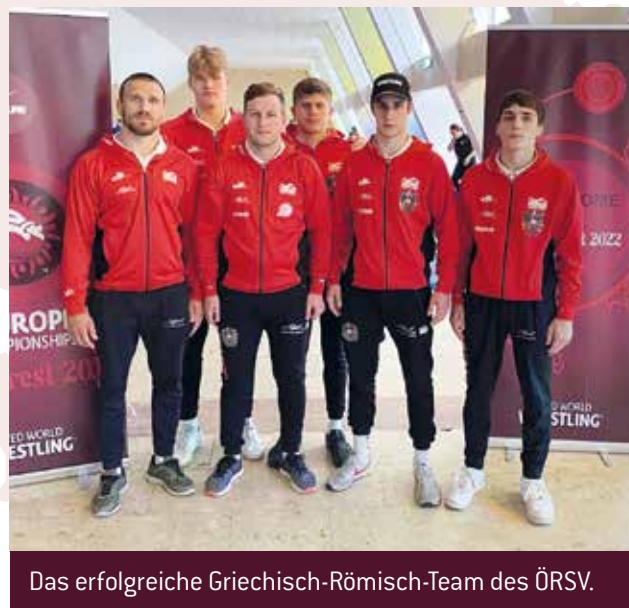
Das erfolgreiche Griechisch-Römisch-Team des ÖRSV.