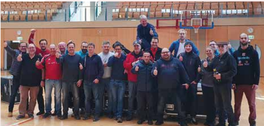
Organisations-Team der U23 Ringer EM in Wals-Siezenheim