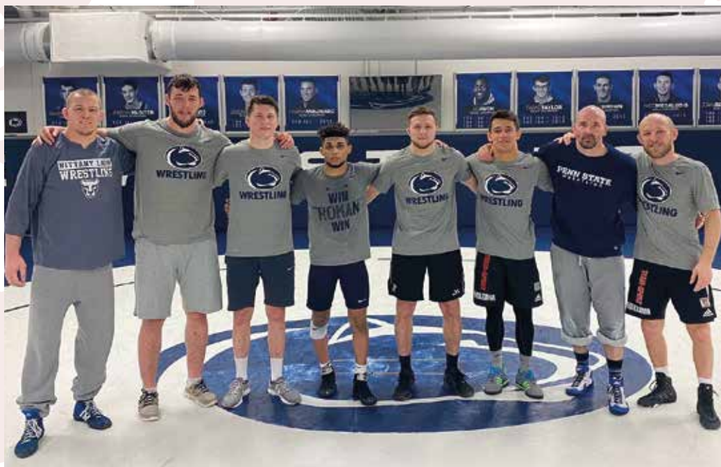
Trainings-Eindrücke aus dem Trainingslager in Penn State auf der nächsten Seite!

„Auch wenn die Trainingseinheiten zum Teil sehr schweißtreibend und hart sind, versuchen wir hier alles aufzusaugen was geht“ (Bundestrainer Lubos Cikel)