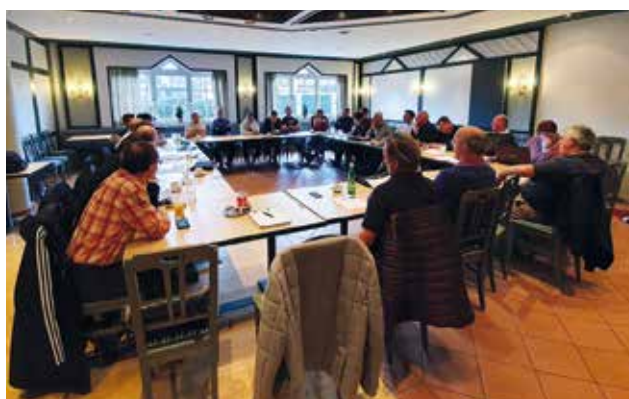
Ligasitzung im Hotel Walserwirt.

Passend zum Olympia- bzw. U-23 EM Jahr 2020 ist dies ein weiterer Meilenstein in der Geschichte des Verbandes.