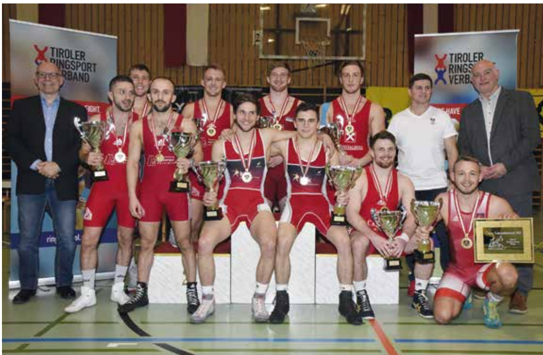
Die österreichischen Staatsmeister 2020.