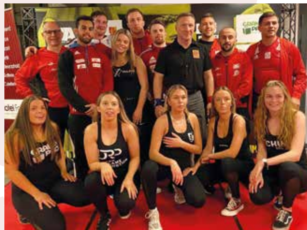
Unser Team in Dänemark.

Anschließend blieb das Team noch im Trainingslager in Dänemark um sich auf die Europameisterschaft in Rom vorzubereiten.