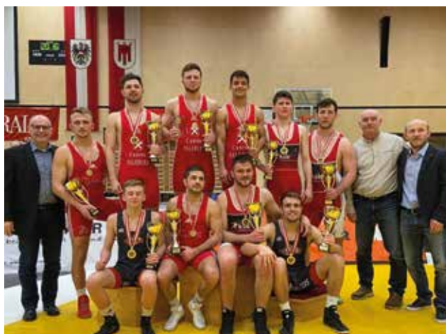
Die österreichischen Staatsmeister 2020 Männer / Freistil.

Ringerinnen und Ringer für die bevorstehenden Olympia-Qualifikationsturniere in Budapest am 19. März und Sofia am 3. April 2020 stimmen zuversichtlich.