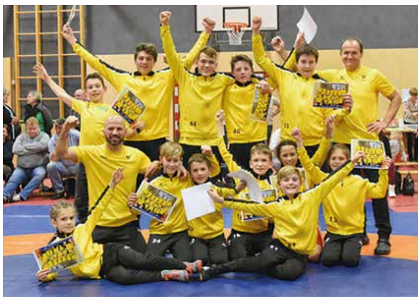
Gratulation an die Schüler der KG Vigaun/Abtenau zum Sieg in der Grenzlandliga.