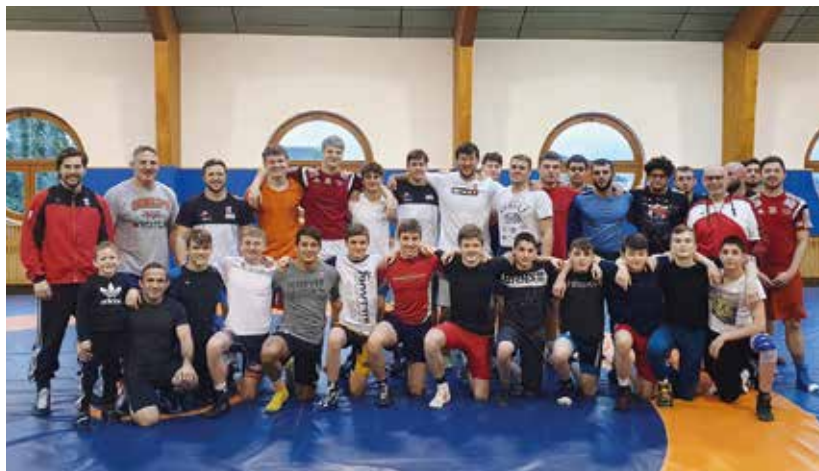
Die Freistil-Nationalmannschaft trainierte in Wals.