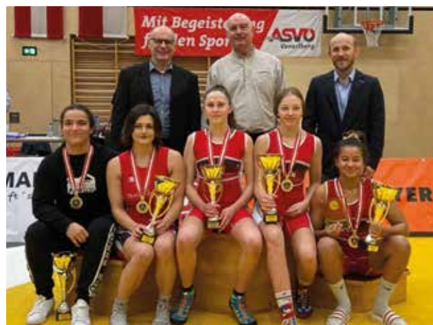
Die österreichischen Staatsmeister 2020 Frauen / Freistil.