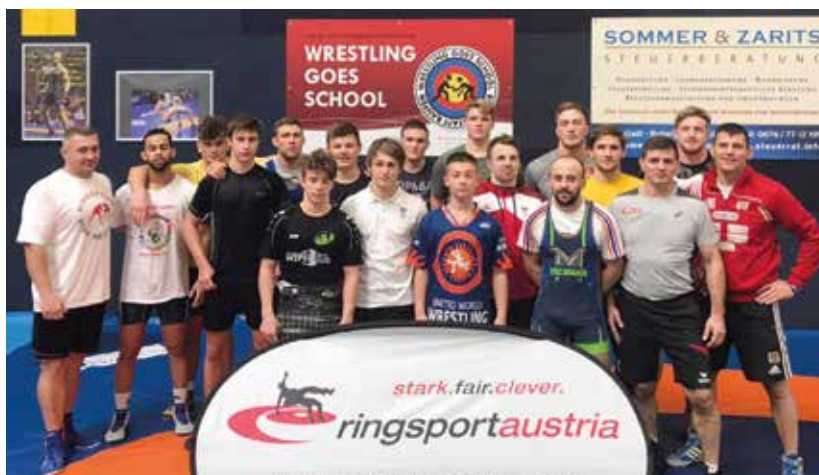
Trainingslager der Griechisch-Römisch Nationalmannschaft in Steinbrunn.