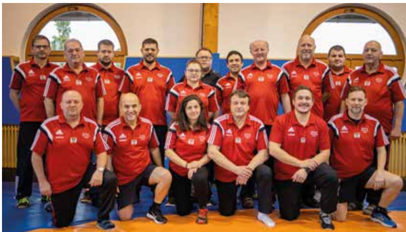
Unsere Kampfrichter beim Lehrgang in Wals.

Gute Stimmung herrschte beim Kampfrichter Lehrgang des Österreichischen Ringsportverbandes im Hotel Laschenskyhof in Wals.