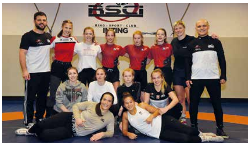
Trainingsauftakt der Frauennationalmannschaft in Inzing.