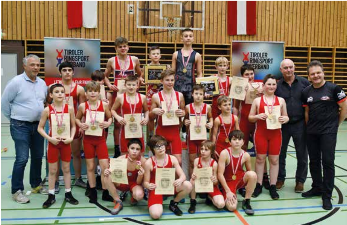
Die österreichischen Staatsmeister 2020.

Insgesamt nahmen 19 Vereine aus ganz Österreich an dieser Schülermeisterschaft teil.